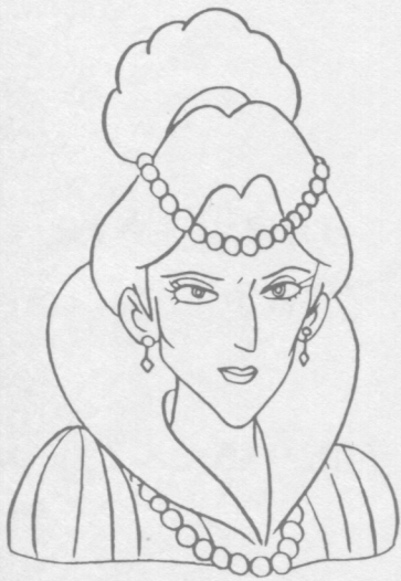
Wicked Queen 魔女のお后